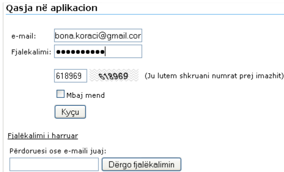
Fig. 6 Pjesa Fjalëkalimi i harruar

Nëse keni harruar fjalëkalimin tuaj, atëherë shtyp në pjesën Fjalëkalimi i harruar pas shtypjes në këtë pjesë hapet faqja që shihet më poshtë: