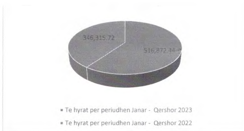
Fig.1. Krahasimi i të hyrave vetanake të vitit 2023 për Periudhën Janar - Qershor me te hyrat vetanake të vitit 2022 duke përfshirë edhe Gjobat në trafik dhe të policisë.

Realizimit të të hyrave financiare krahasuar me vitin paraprak (Janar - Qershor 2022 dhe janar – Qershor 2023).