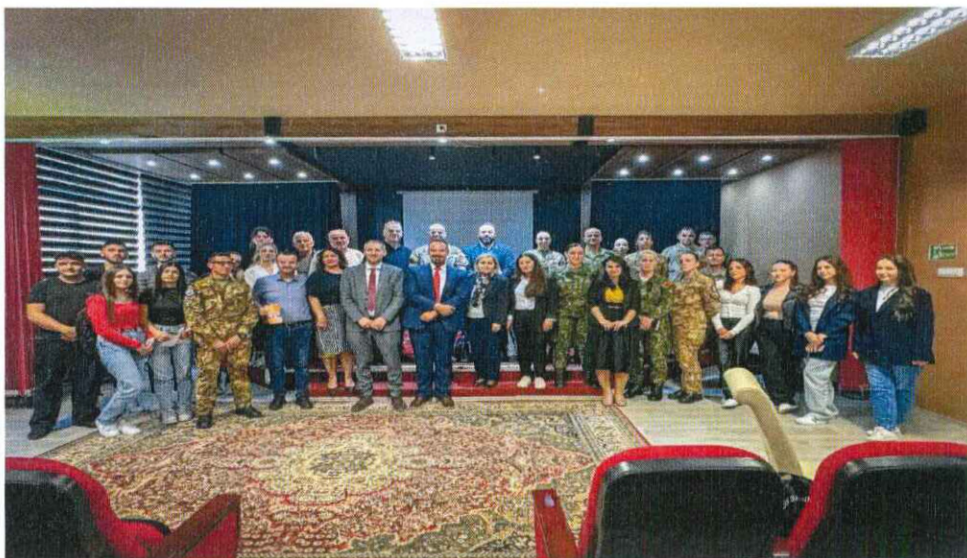
Foto nga aktivitetit. Foto dhe fletëpalosja që u shpërnda pjesëmarrësve

Këtë aktivitet KFOR-i e mbështeti me sigurimin e pijeve freskuese për pjesëmarrësit që ishin) nxënës të gjymnazit po ashtu ky aktivitet u përkrahë edhe nga komuna e Deçanit