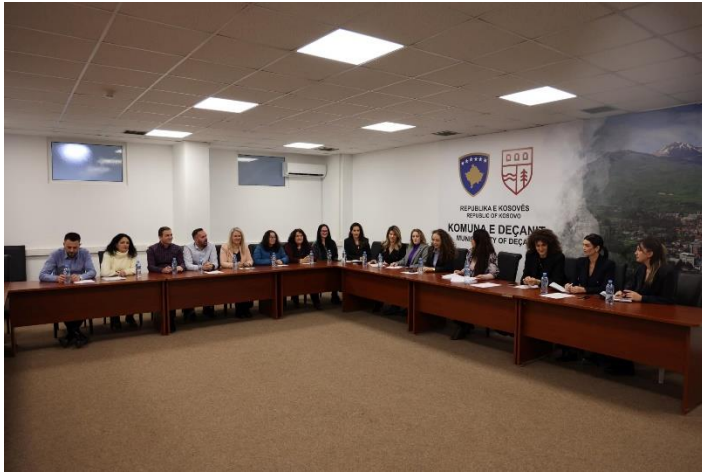
Foto: Debati për Strategjinë Komunale Kundër Dhunës në Familje (2024 – 2027)