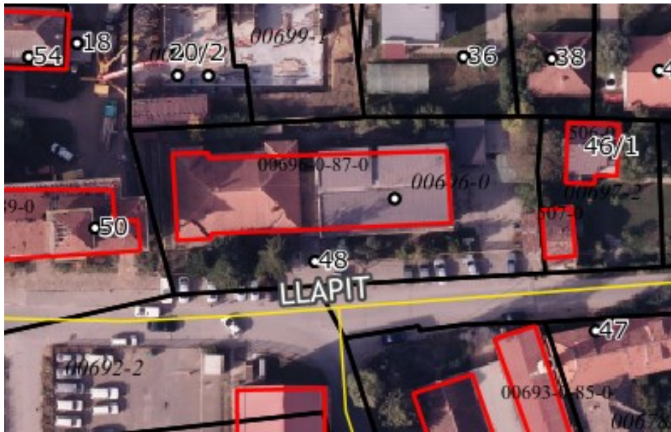
Lokacioni i Parcelave. (GeoPortal Kosova)