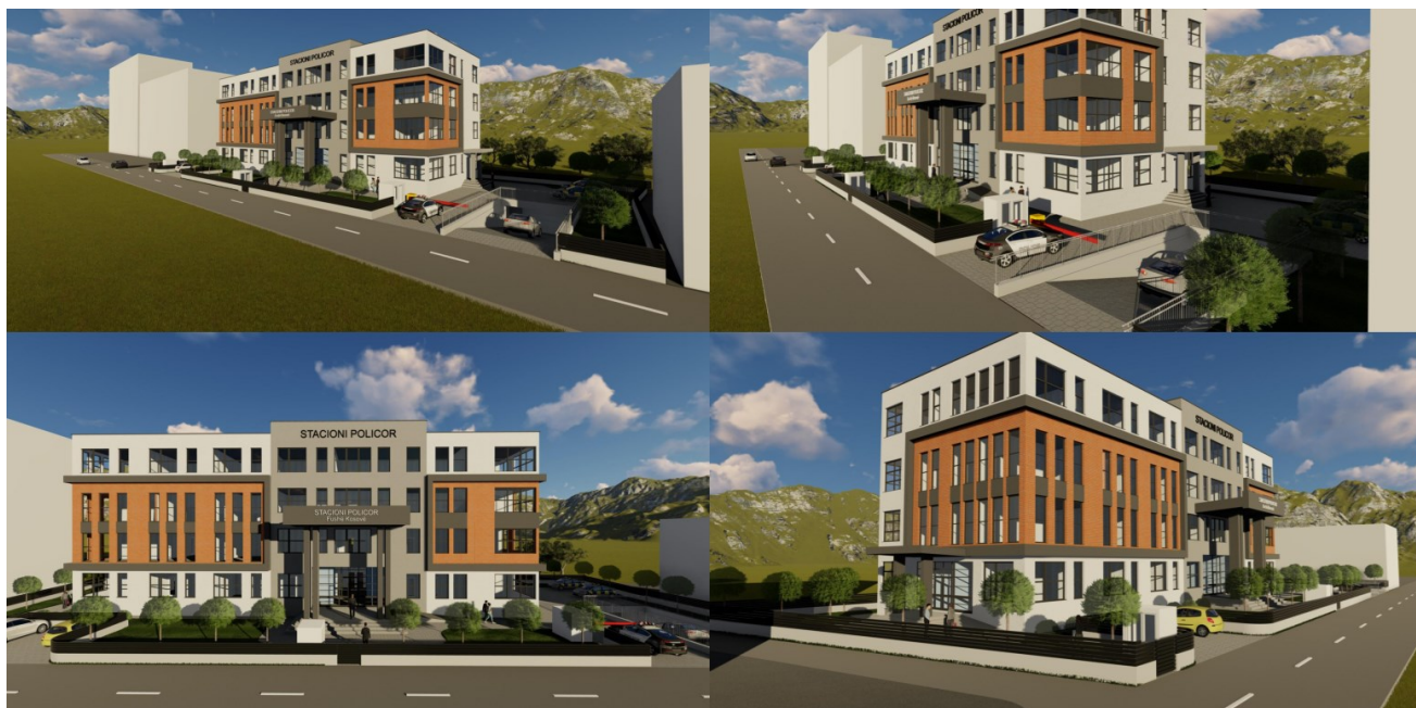
Lokacioni i ngushte