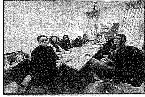
Vizitë në SHFMU : "M. Grameno" – aneksi 3