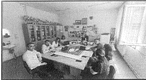
Vizitë në SHFMU : "M. Grameno" – amë