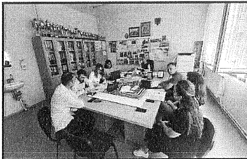
Vizitë në SHFMU : "M. Grameno" – amë