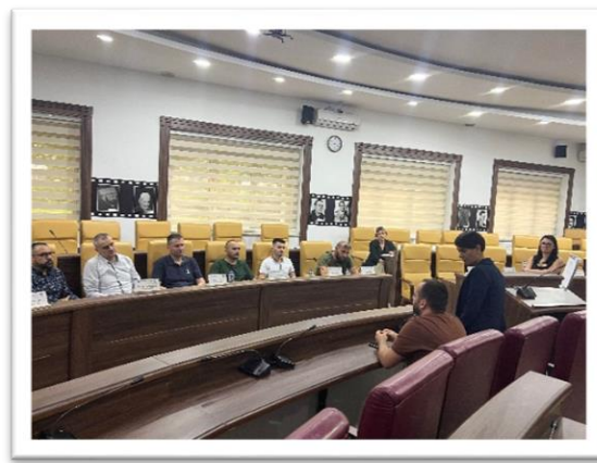
Foto nga takime e para - procesi i marrjes se propozimeve.