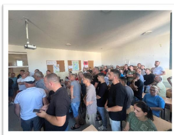
Foto nga takime e dyta - procesi i votimit.