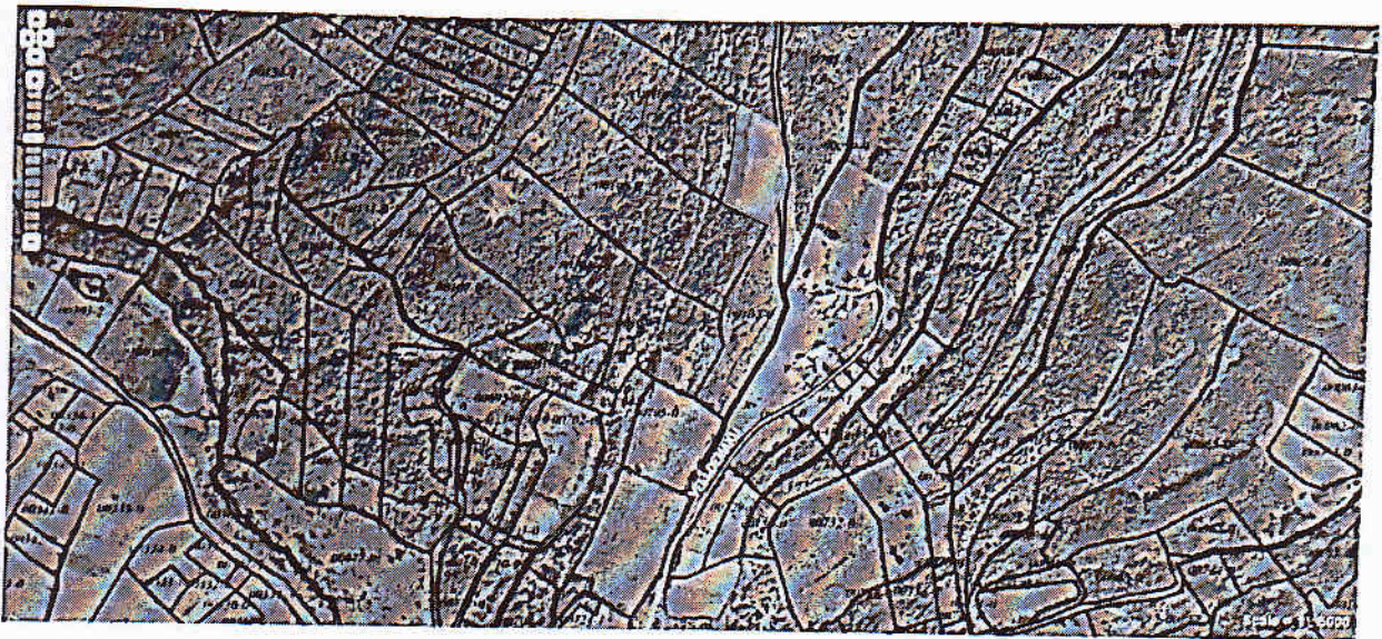
Lokacioni i propozuar për ndërtimin e Rezervuarit kryesor 1000m 3