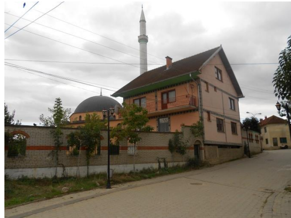
Foto 18. Shtegu shpirtëror