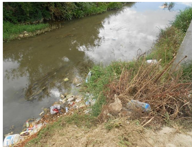
Foto 14. Mbeturinat në lum