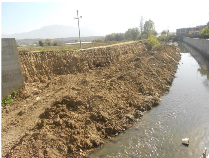
Foto 20.Mbrotja e tokes nga vershimet