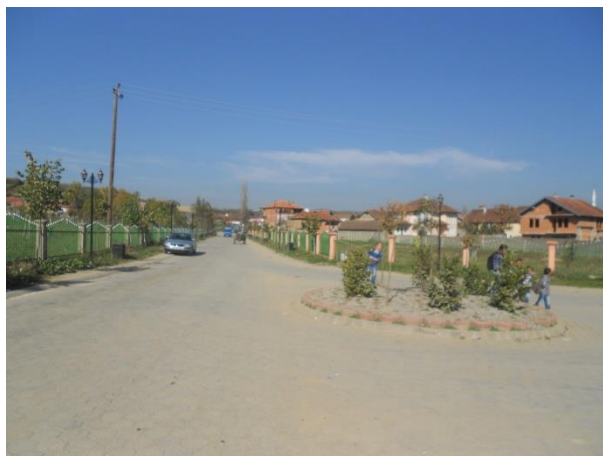
Foto 11.Rrugët e mamushës

Prioritet për vendosjen e vend parkingjeve duhet të jetë përgjatë rrugës kryesore dhe para objekteve publike.