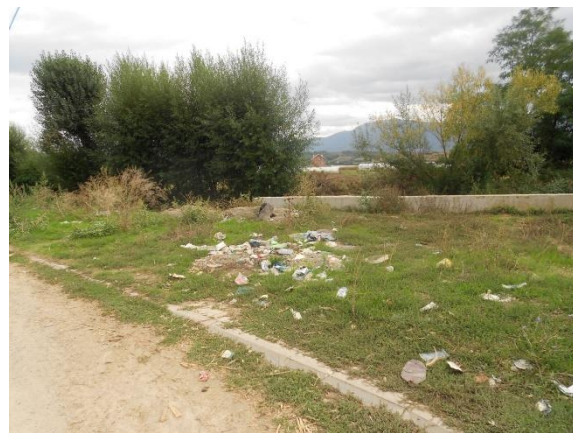
Foto 21.Hudhja e mbetjeve plastike në lum –Foto 22.Mbeturina ne vende publike