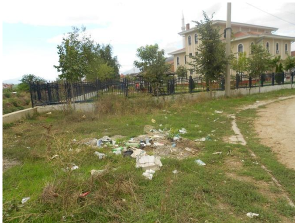
Fot 13. Hudhja e mbeturinave në vende publike