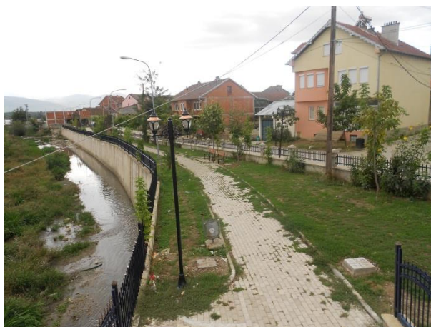
Foto 8.Parku buz Lumit