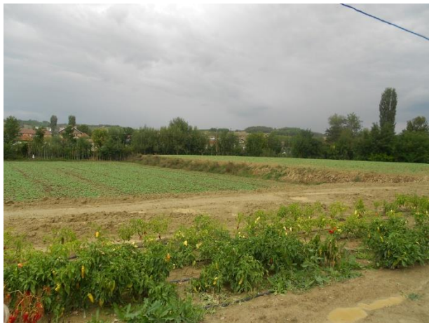
Foto 15. Punimi I tokës

përcaktohet atëherë kur do të zgjidhet çështja e pronës. Megjithatë, toka është një zone potenciale për zhvillimin e ardhshëm të aktiviteteve ekonomike.