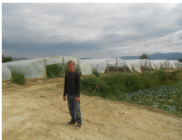
Foto 16. Punimi I tokës ne serra