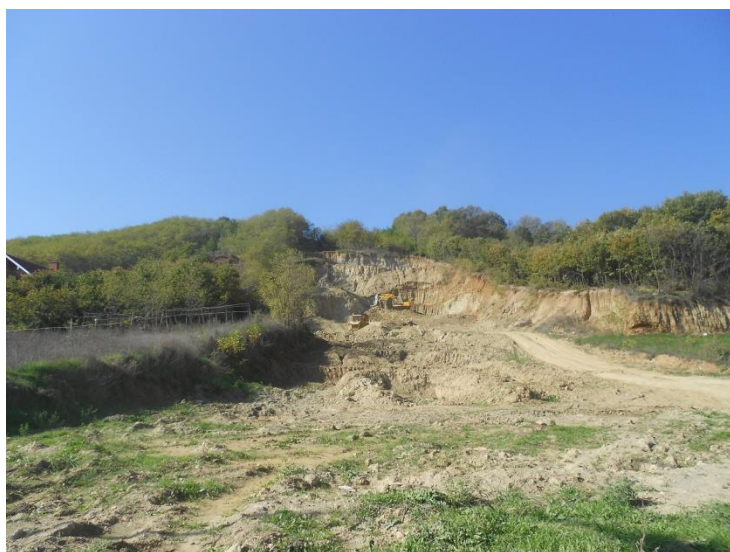
Degradimi I tokes- rrezik nga vërshimet

Përafërsisht 550 hektarë të tokës bujqësore është në pronësi private, shumica e fermerëve kanë parcela të vogla të tokës. Lidhur me pronësinë e tokës kjo zonë është e përbërë nga toka në pronësi të personave privatë që mbulojnë një përqindje më të lartë të kësaj zone, komuna dhe Agjencia Kosovare e Privatizimit. Rreth 55% e parcelave në këtë fushë janë të madhësive së vogël 0-2500,0 m 2 . Mamusha është i përbërë nga toka bujqësore e kualitetit të mirë, e cila është shumë e përshtatshëm për prodhimin e perimeve dhe drithërave.