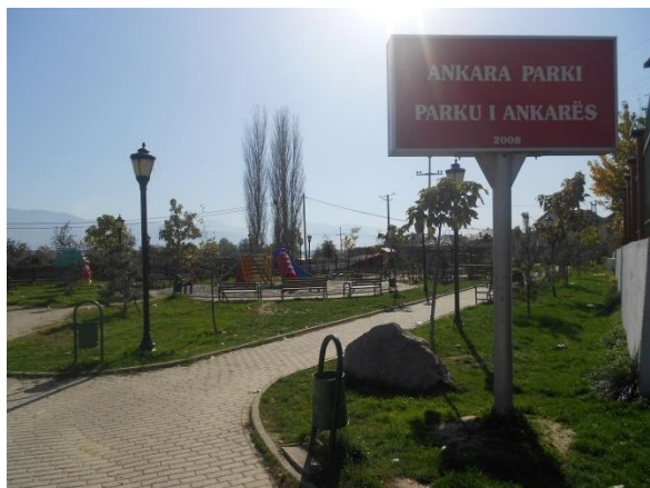
Foto 7.Parku Ankara