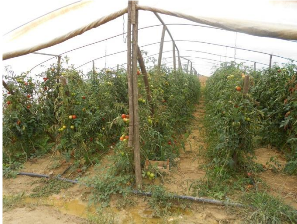
Foto 17. Kultivimi i domatës

paraqet pikënisjen e vendbanimit, kur arrihet nga Komuna e Prizrenit. Duke pasur parasysh se feja është pjesë shumë e rëndësishme e identitetit të Mamushës dhe Xhamia e Re përkujdeset që të zhvillohen aktivitete të përditshme, plani propozon krijimin e një linje që përveç lidhjes me zonën qendrore, ka për qëllim të ofrohet një shëtitore në të cilën do zhvilloheshin aktivitete që mundësojnë socializimin, me fokus të veçantë për të moshuarit.