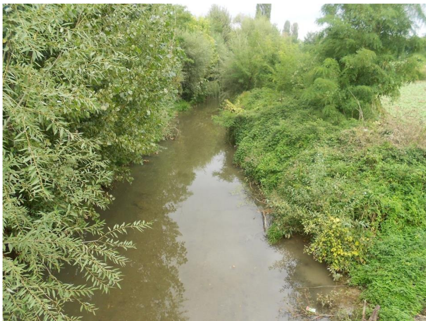
Foto 19.Koridoret e gjelbërta