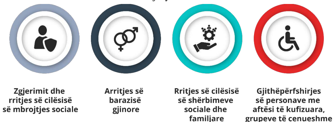
Figura 2: Orientimet e nivelit komunal drejt synimeve

Këto synime pritet që të kontribuojnë drejt orientimit të nivelit komunal në avancimin e mirëqënies sociale të qytetarëve përmes formave sikurse në vijim: