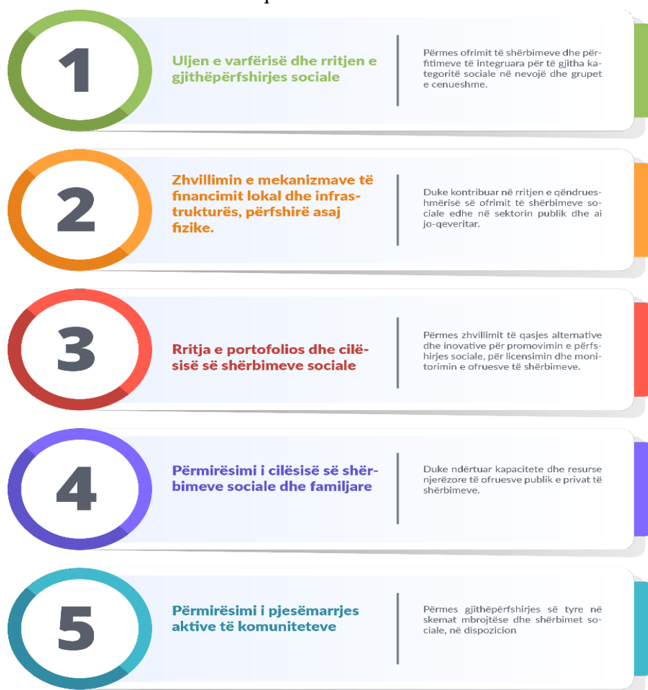
Figura 3: Format në avancimin e mirëqënies sociale

Këto synime pritet që të kontribuojnë drejt orientimit të nivelit komunal në avancimin e mirëqënies sociale të qytetarëve përmes formave sikurse në vijim: