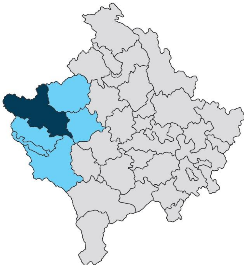
Figura 1: Vendndodhja e komunës dhe rajonit të Pejës në Kosovë

Trendi i zhvillimeve nga viti 1970 deri në vitin 1980 dëshmon që e gjithë komuna e Pejës është zhvilluar në mënyrë të njëtrajtshme. Koncentrimi i zhvillimeve ka qenë më i madh në qytetin e Pejës, ndërsa më i shpërqendruar dhe i pa balancuar në zonat rurale. Në 20 vitet e fundit vërehet trendi i shtuar i migrimit të brendshëm nga i cili presioni më i madh është orientuar në zonën urbane të komunës. Pasojë e këtij zhvillimi të pa balancuar në mes të zonës rurale dhe urbane, është humbja relativisht e madhe e tokës bujqësore në komunë.