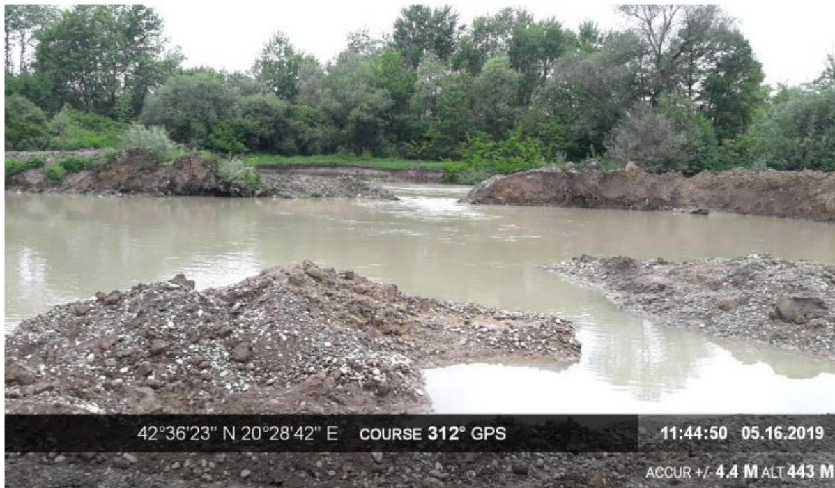
Foto: Dëmtimi i shtratit të lumit në Lumbardhin e Pejës