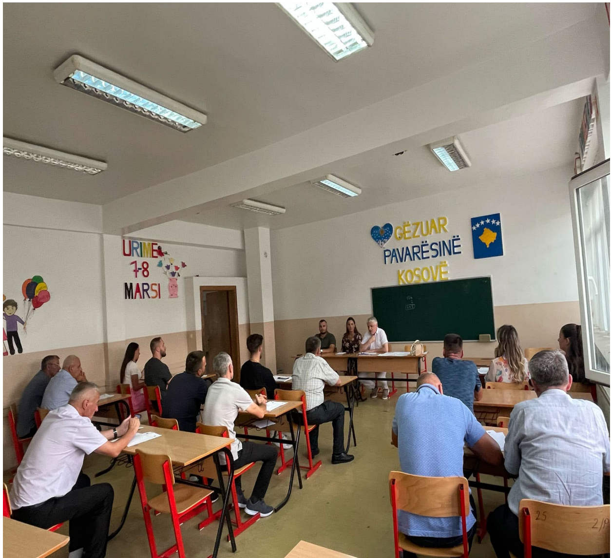
Foto 1. Fotografî gjatë mbajtjes së takimit.