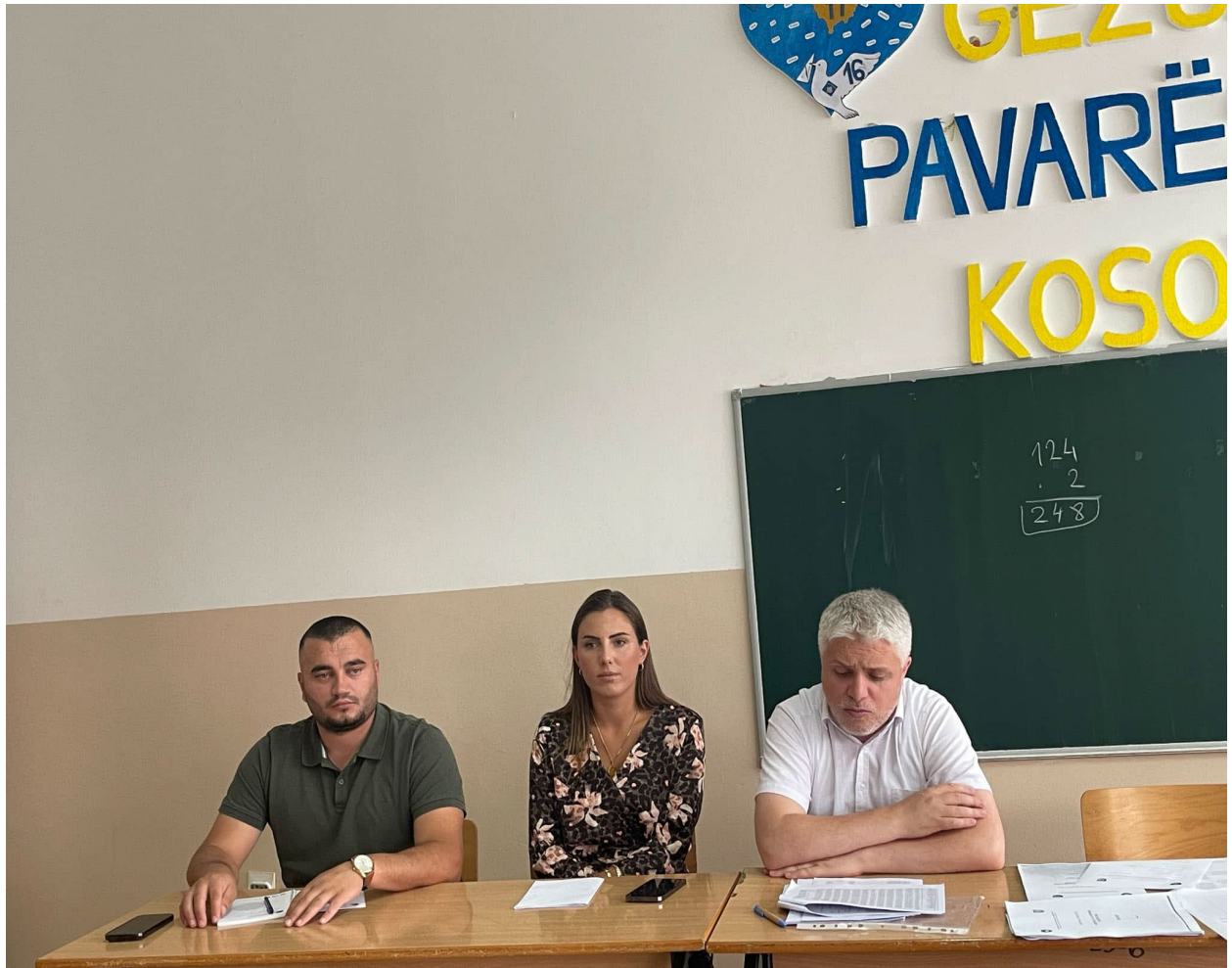
Foto 2. Fotografi gjatë mbajtjes së takimit.