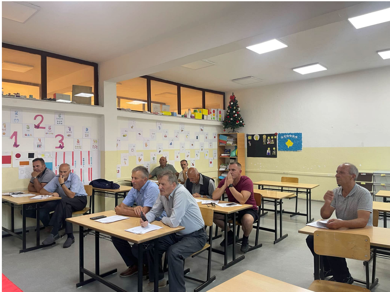
Foto 1. Fotografi gjatë mbajtjes së takimit.