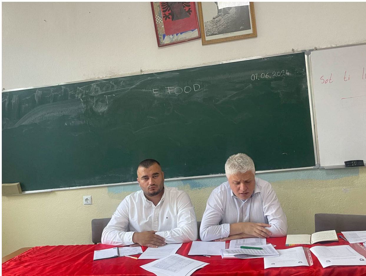
Foto 2. Fotografi gjatë mbajtjes së takimit.