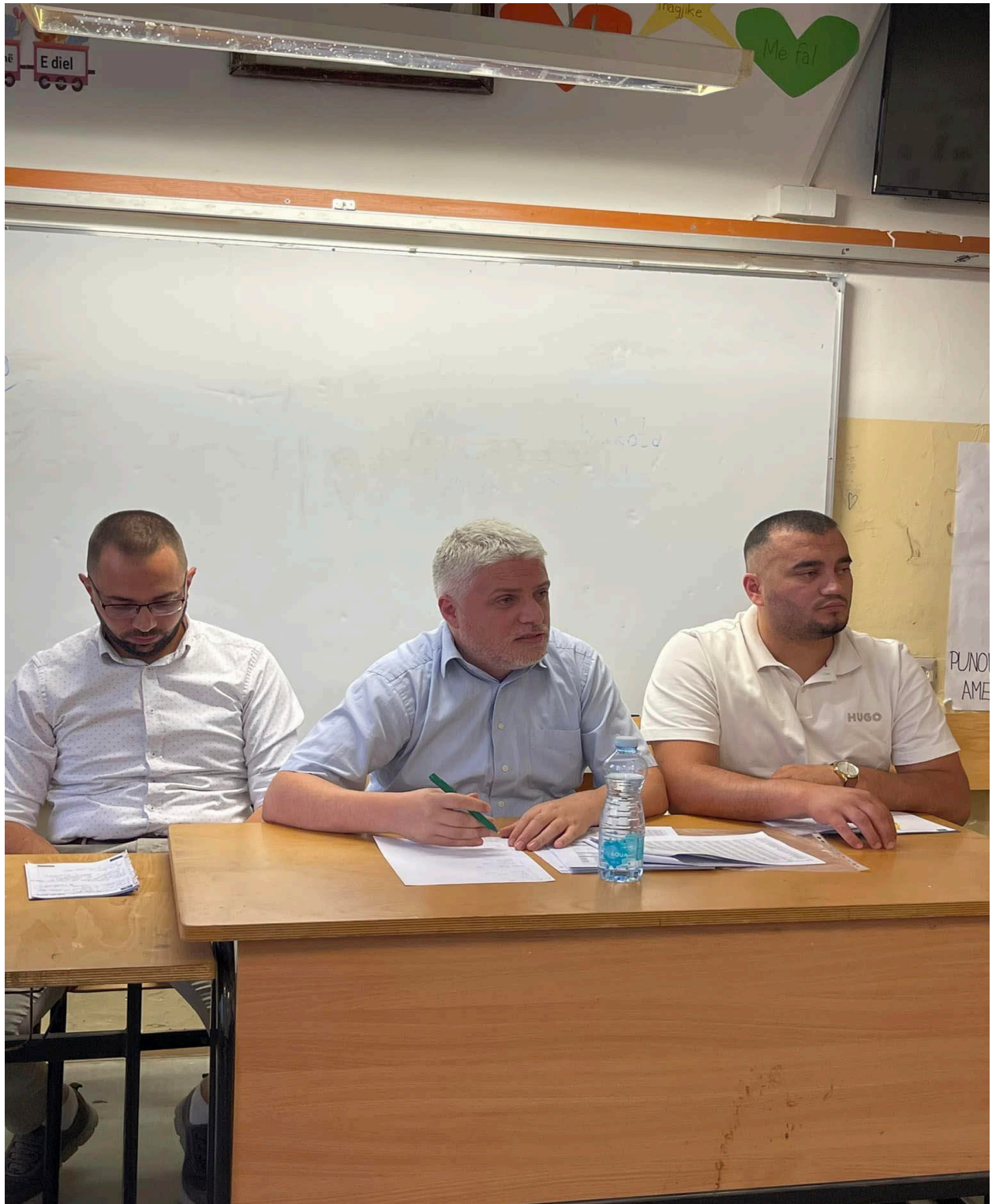
Foto 2. Fotografi gjatë mbajtjes së takimit.