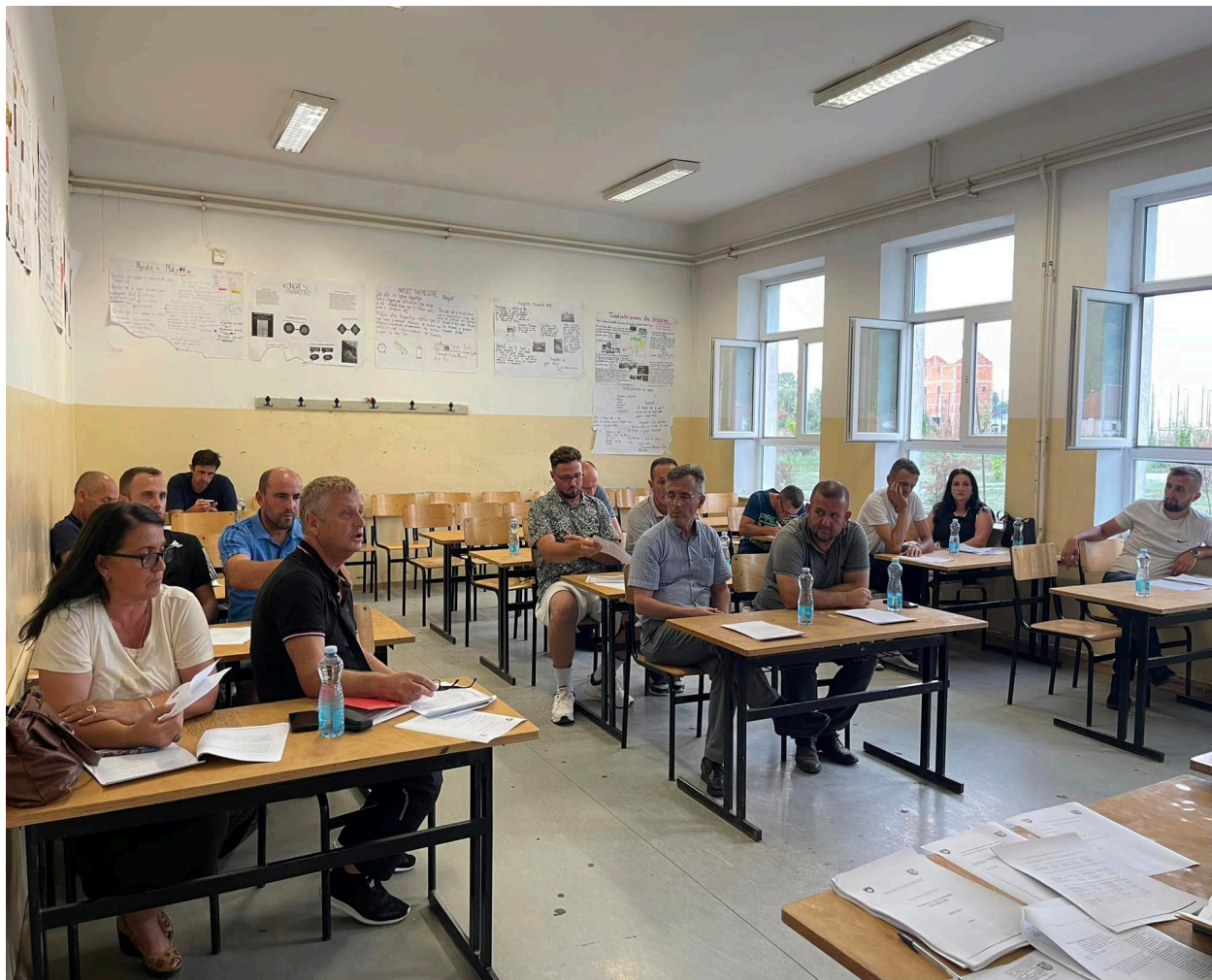
Foto 1. Foto gjatë mbajtjes së takimit.