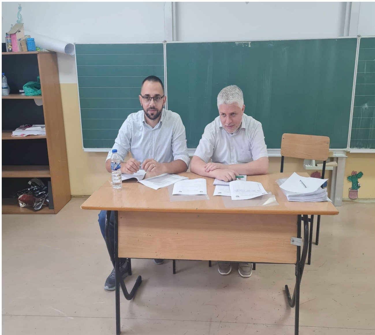
Foto 2. Fotografi nga mbajtja e takimit.