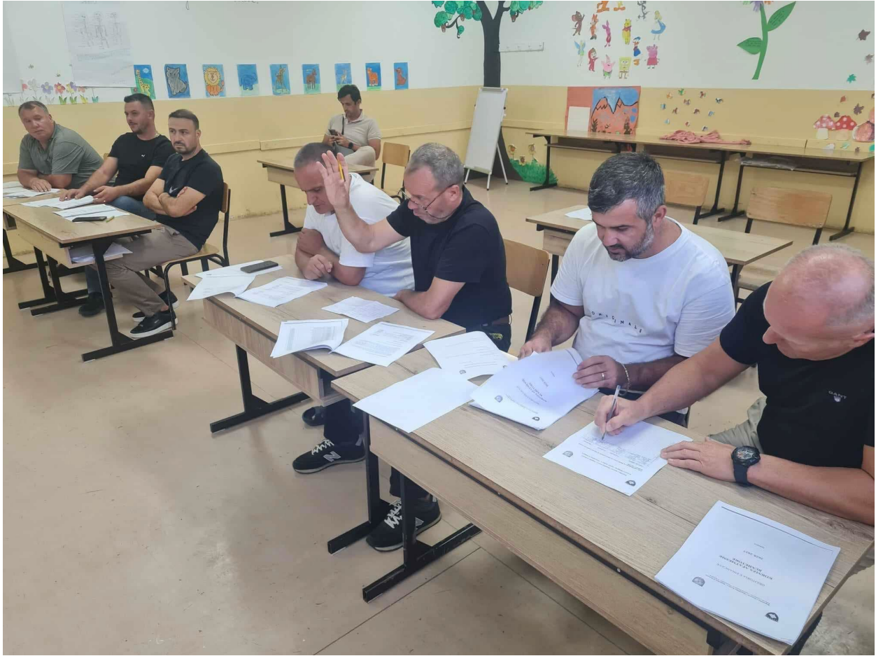
Foto 1. Fotografi nga mbajtja e takimit.