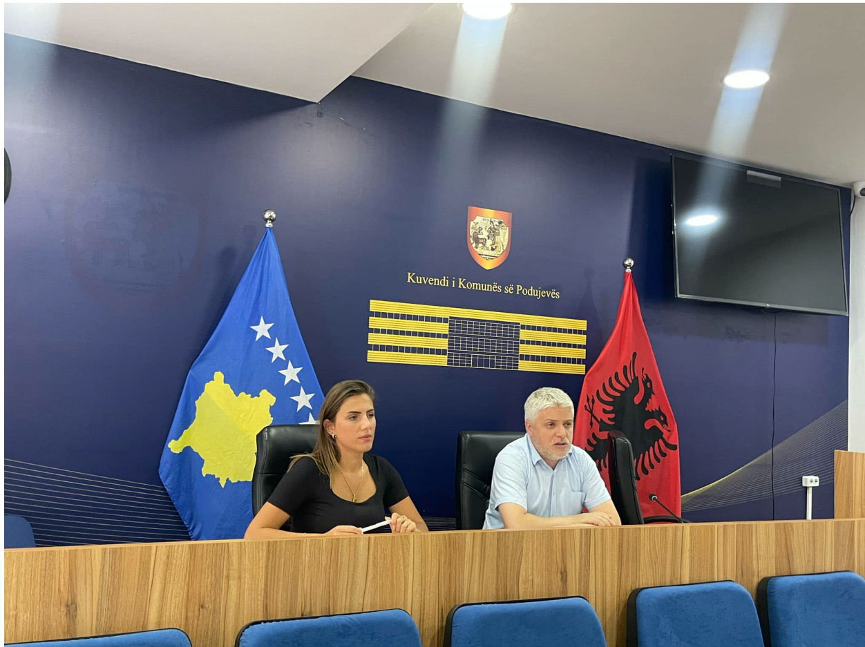
Foto 1. Fotografi gjatë mbjartjes së takimit.