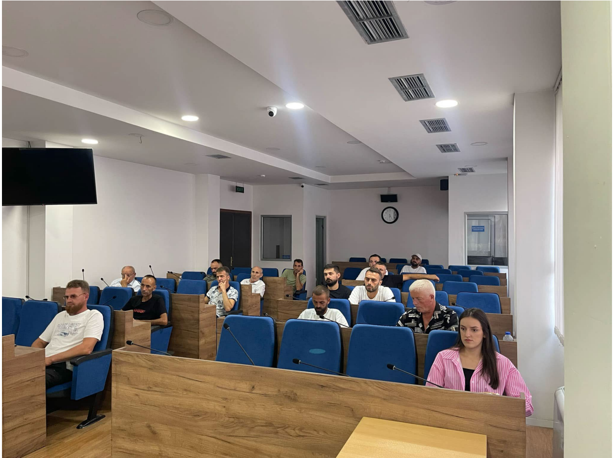
Foto 2. Fotografi gjatë mbjates së takimit.