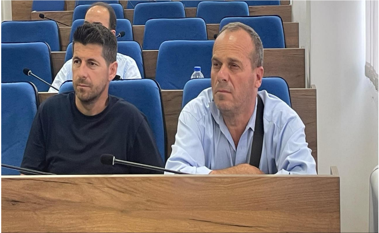
Foto 1. Fotografi gjatë mbajtjes së takimit