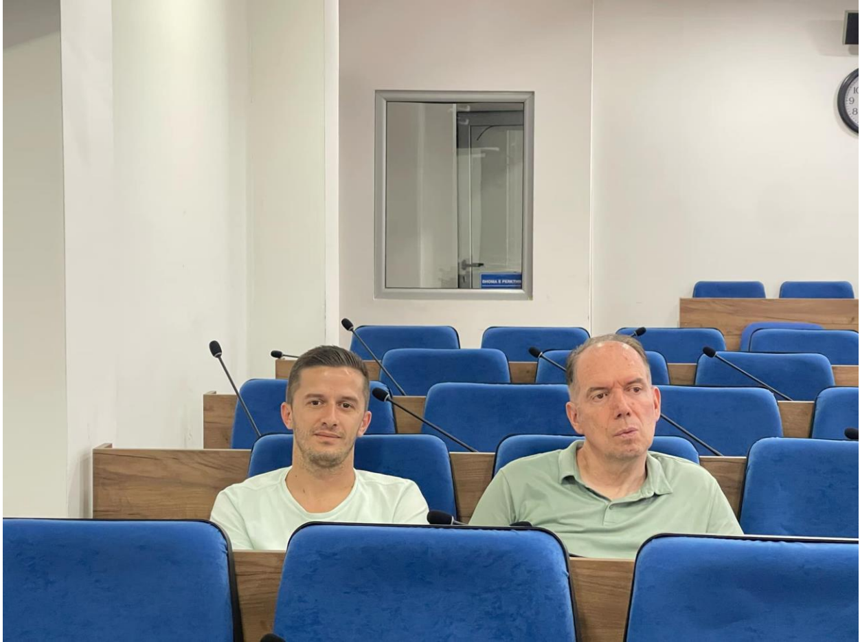
Foto 3. Fotografi gjatë mbajtjes së takimit