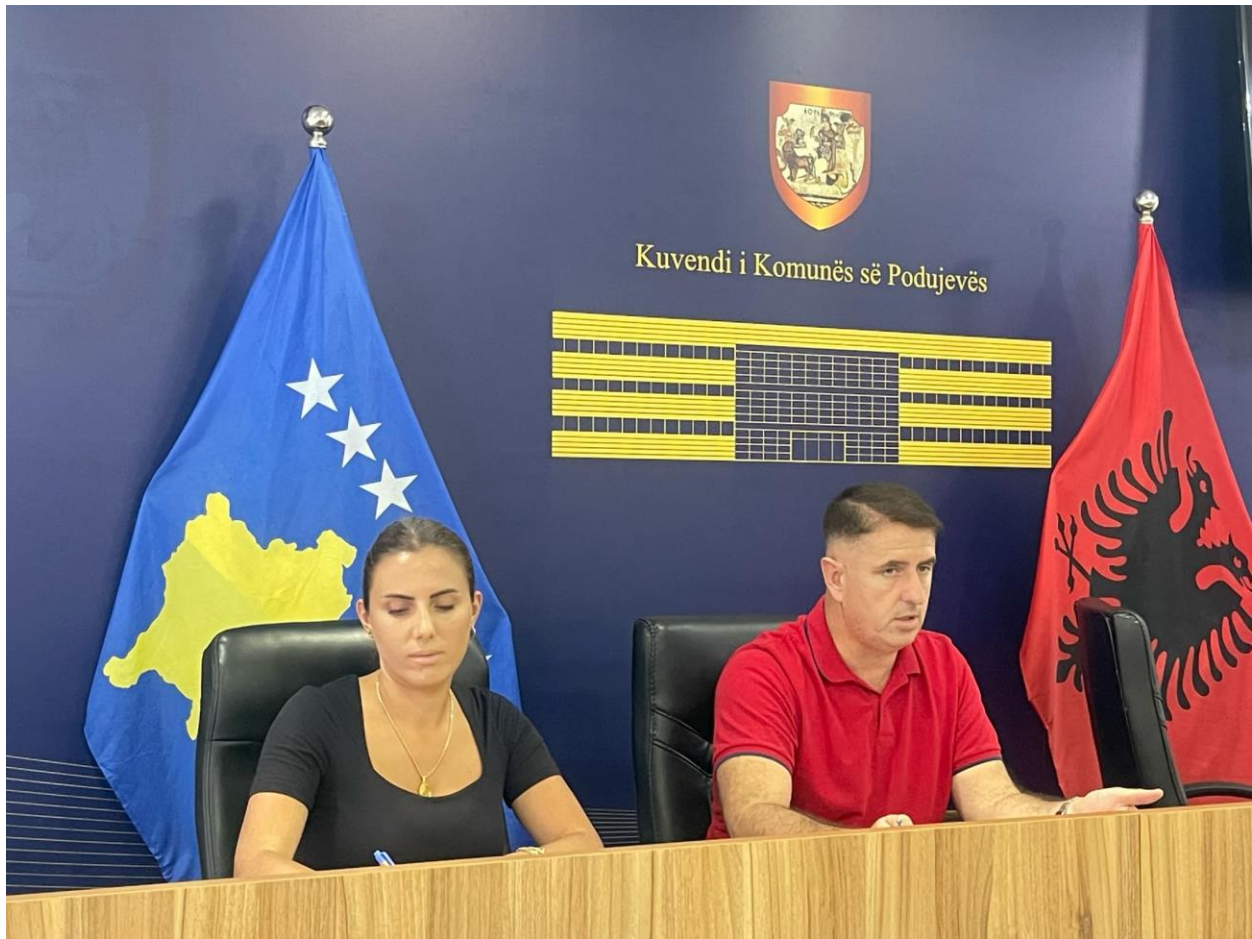
Foto 2. Fotografi gjatë mbajtjes së takimit