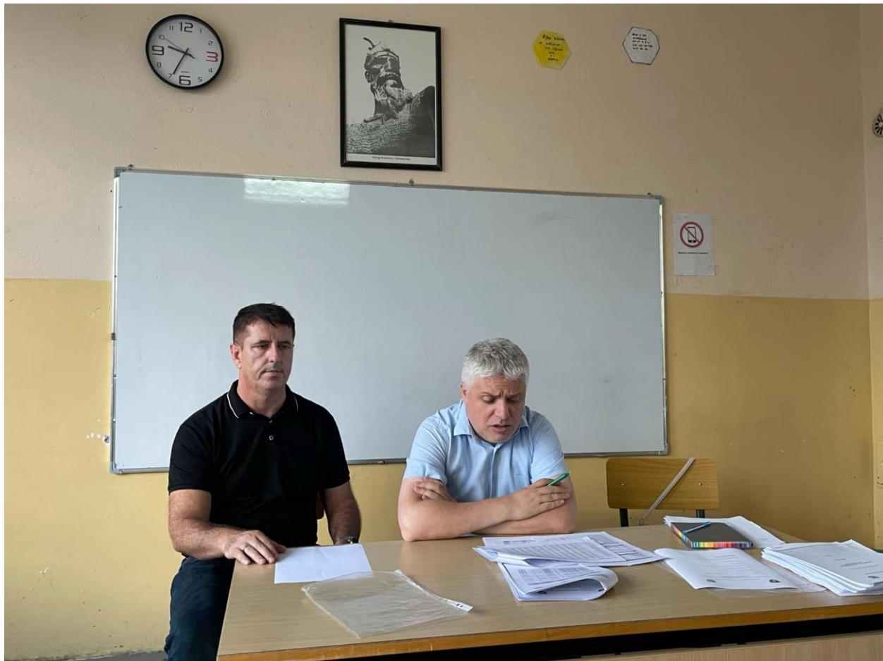
Foto 2. Fotografi nga mbajtja e takimit.