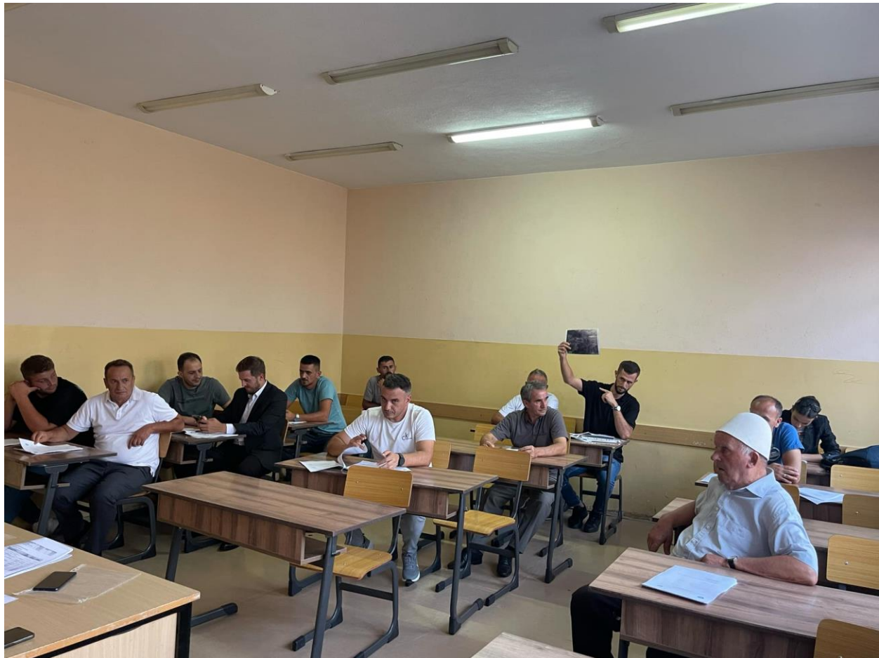
Foto 1. Fotografi nga mbajtja e takimit.