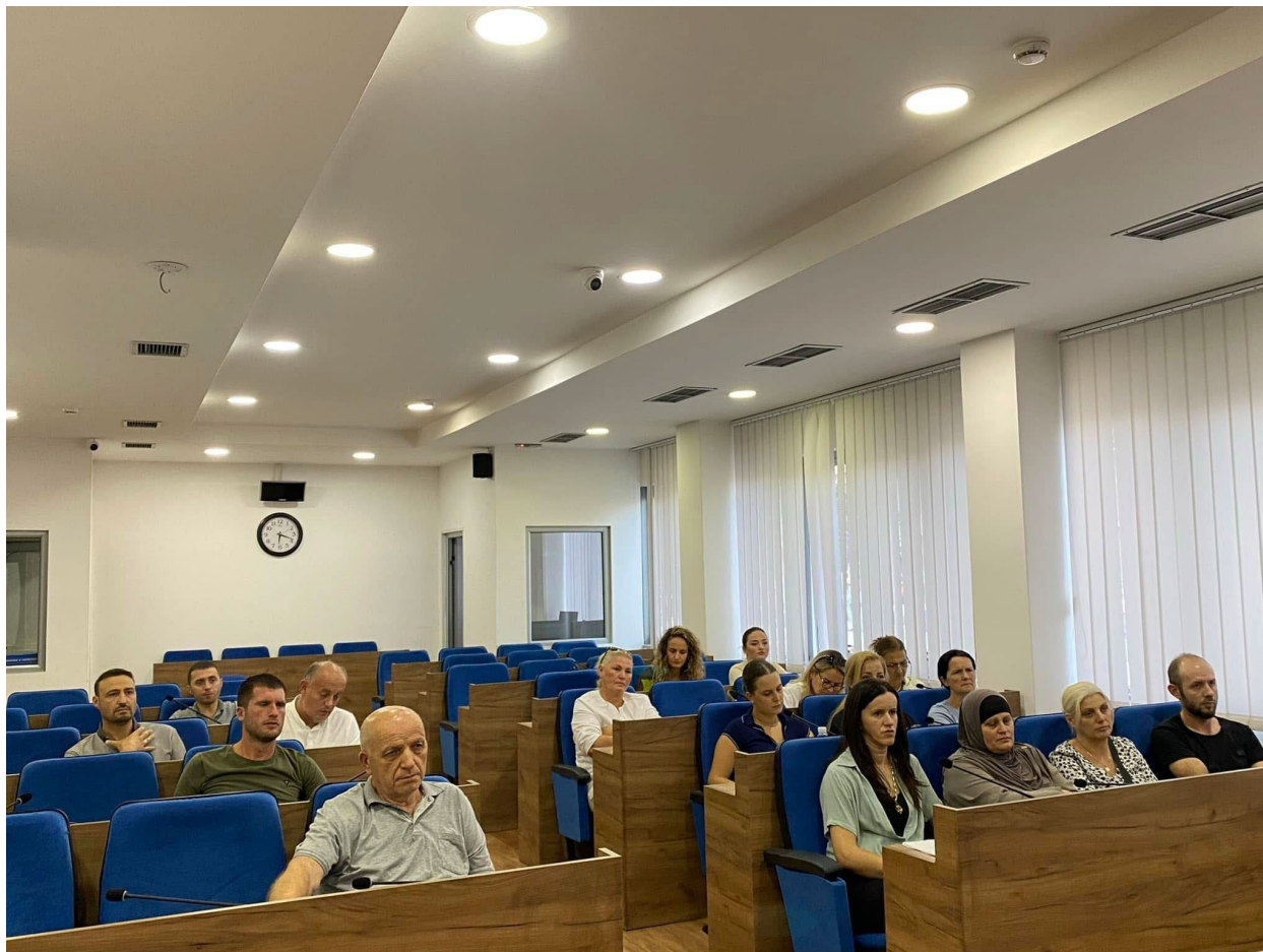
Foto 2. Fotografi gjatë mbajtjes së takimit.