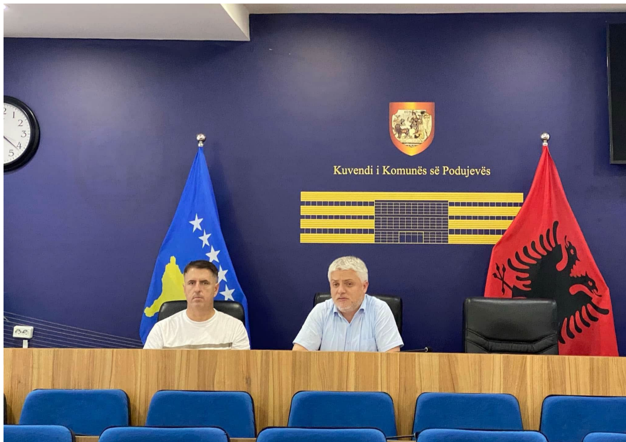
Foto 1. Fotografi gjatë mbajtjes së takimit.