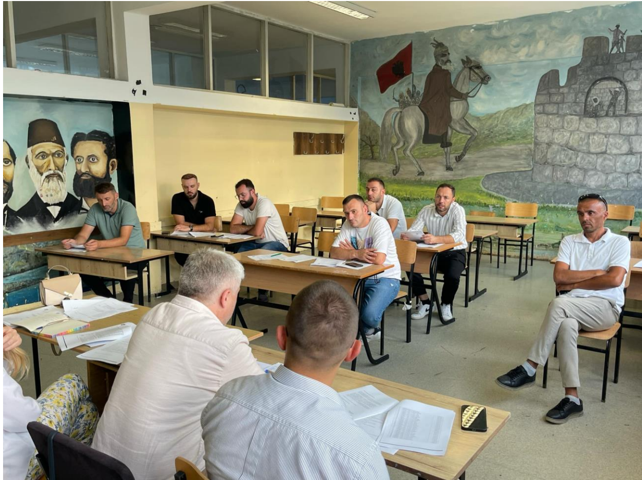
Foto 1. Fotografi gjatë mbajtjes së takimit.