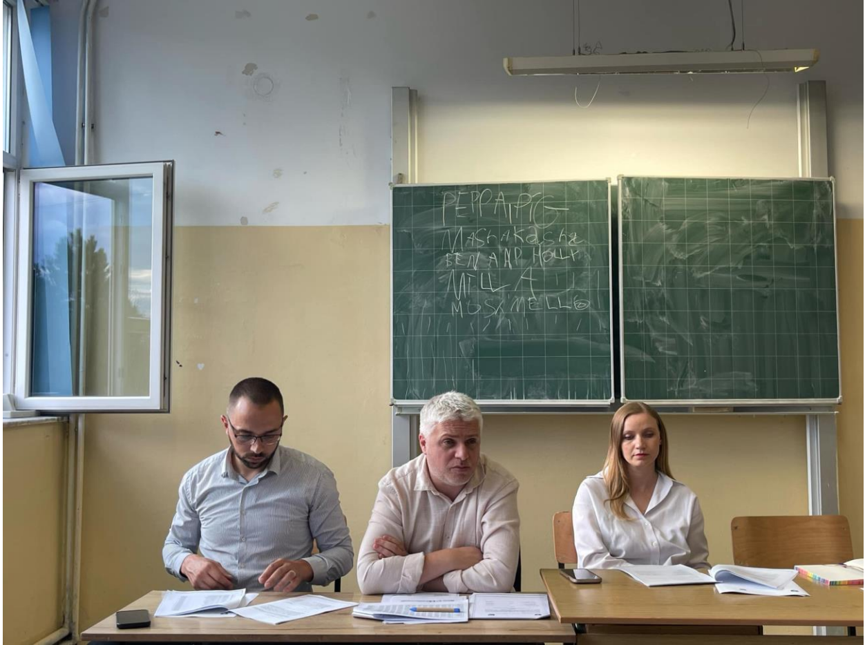
Foto 2. Fotografi gjatë mbajtjes së takimit.