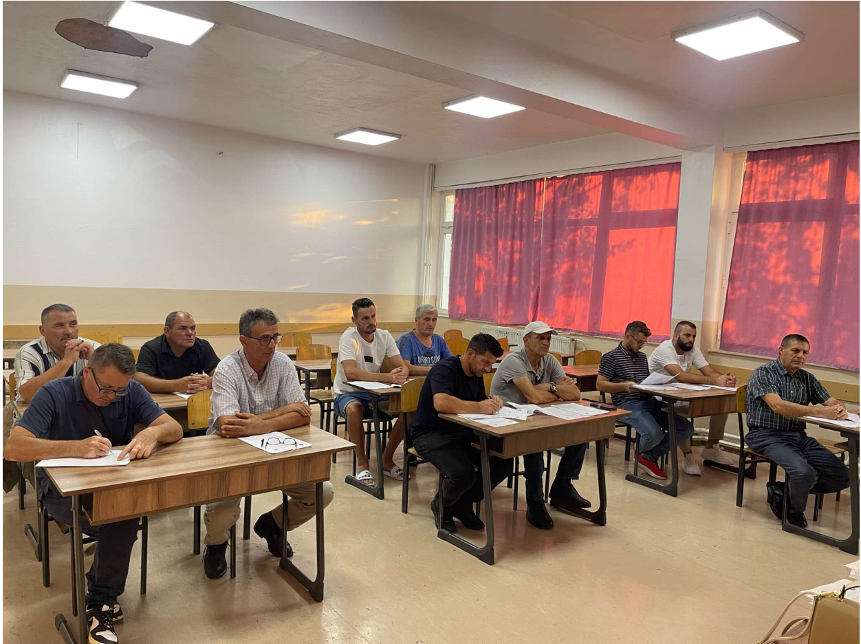
Foto 1. Fotografi gjatë mbajtjes së takimit.