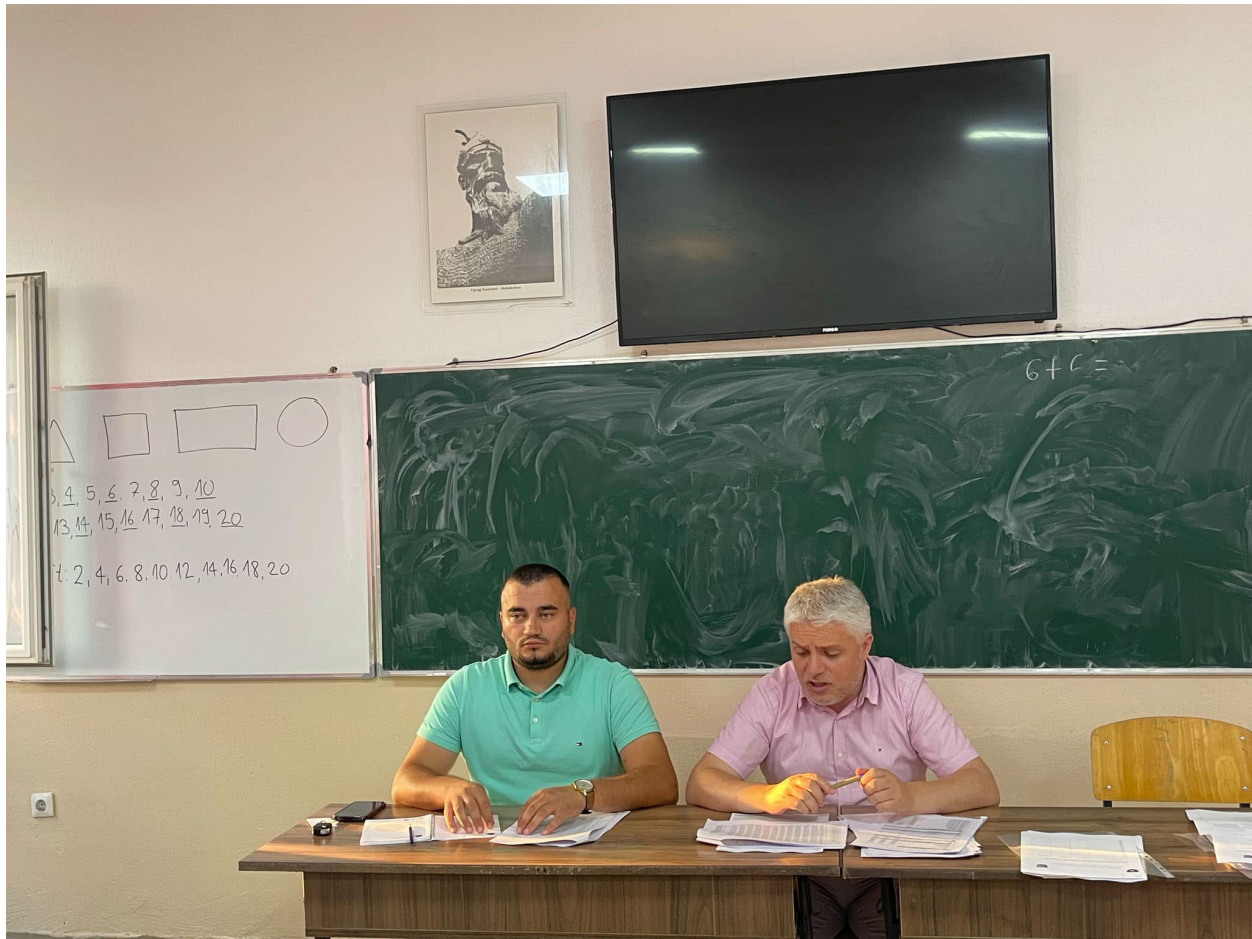
Foto 1. Fotografi gjatë mbajtjes së takimit.