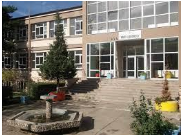
Fig.3 – NSOŠ "Mati Logoreci"

Opština Prizren ima 59 osnovnih i nižih srednjih škola, kao i više srednjih škola, dok je broj javnih obdaništa 2. Nižih osnovnih škola ima 52, dok je viših srednjih škola 5. Škole u gradskim naseljima ima 22, dok je škola u seoskim naseljima 37. Broj učenika u opštini Prizren za školsku 2023/24. godinu je 24,351 učenik, koji pohađaju nastavu na tri nivoa. Broj angažovanog osoblja za školsku 2023/24. godinu (uključujući akademsko i administrativno osoblje) je 1,978 nastavnog i administrativnog osoblja. Školska sprema akademskog osoblja je: 3 doktora nauka, 234 magistra nauka, osoblje sa fakultetom je 1,663, dok je 78 osoblje sa visokom stručnom spremom. Broj učenika koji putuju u školu je 249 učenika.