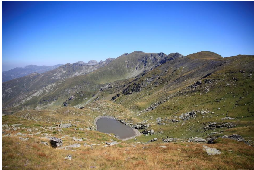
Fig.6 – Jezera Šarskih planina