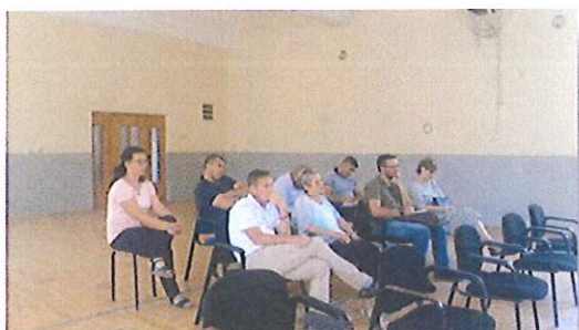
Hoçë e Madhe