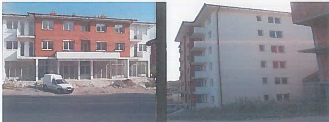
Figura 5. Ndërtesa e banimit social me 18 njësi banimi

sociale. Në Rahovec është ndërtuar një ndërtesë e banimit social në vitet 2015-2016, me 18 njësi banesore. Ndërtesa ende nuk është lëshuar në përdorim pra nuk ka ende sistem për mbledhje të qirasë joprofitabile dhe ende nuk faturohet nga komuna.