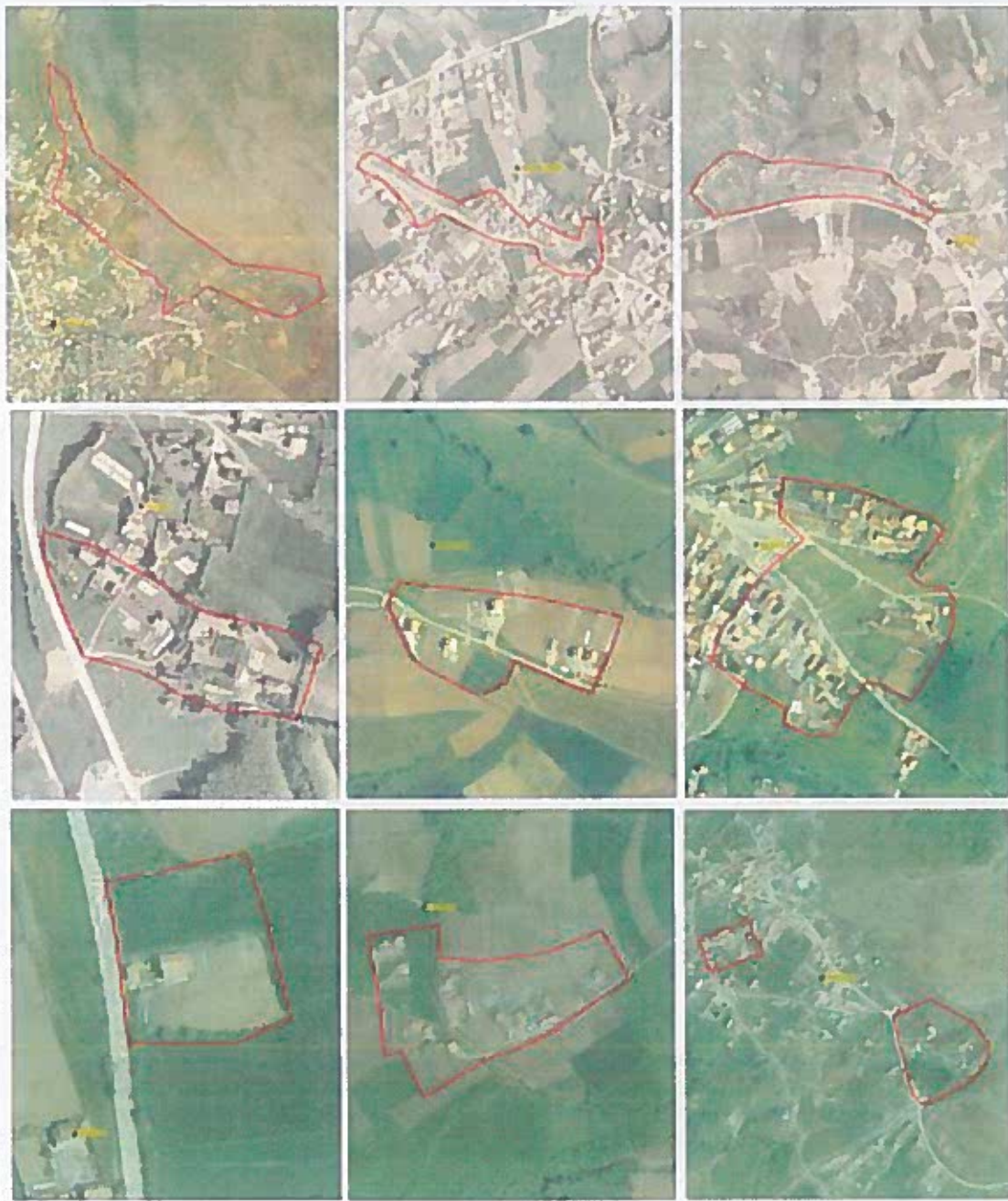
Figura 3.Vendbanimet joformale në Rahovec