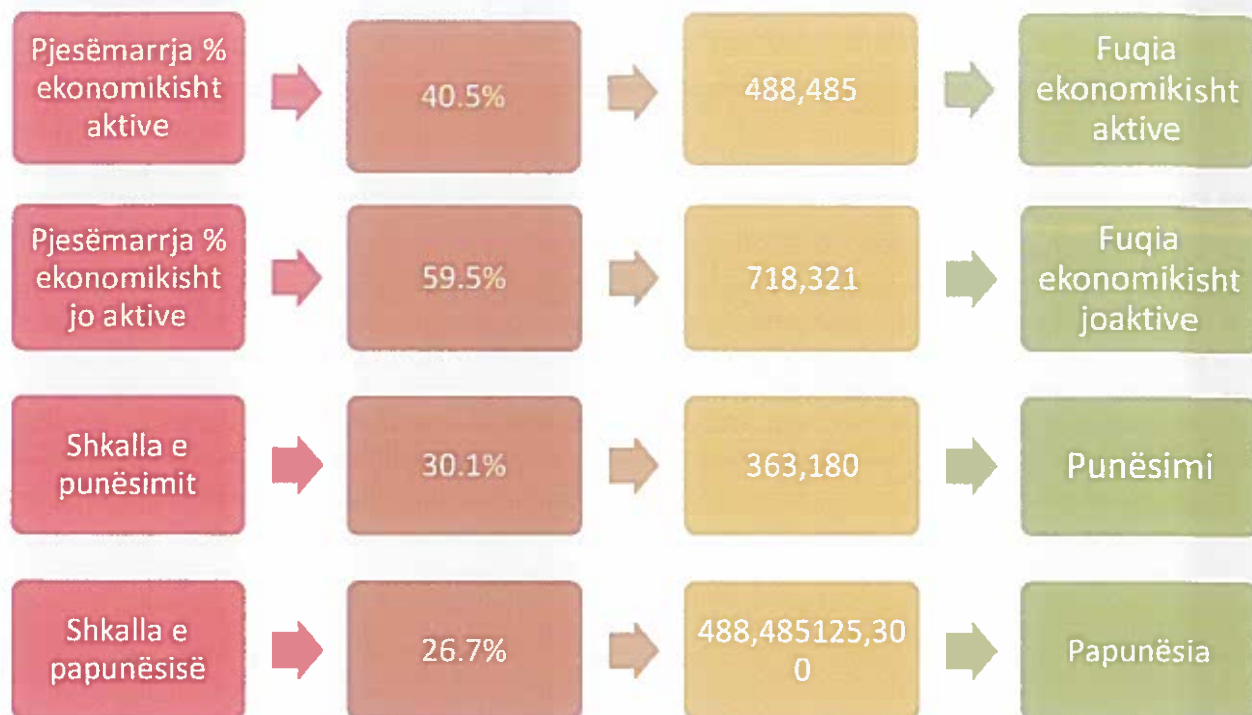
Figura 2. Punësimi dhe papunësia në Komunën e Rahovecit