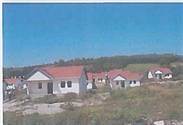
Figura 4. Foto nga shtëpitë e realizuara ne Komunën e Rahovecit

Shtëpitë e realizuara shumica janë të paizoluara dhe mund të konsiderohen si zgjidhje emergjente.