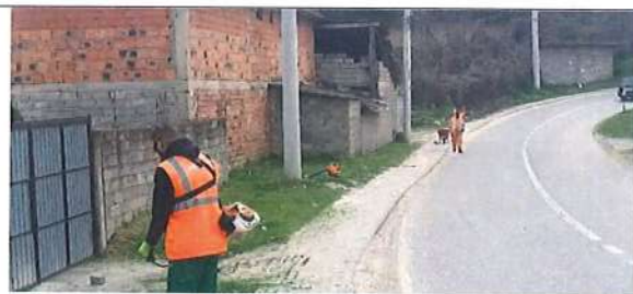
Fotografija tokom izvođenja radova