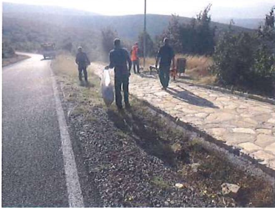
Fotografija tokom izvođenja radova