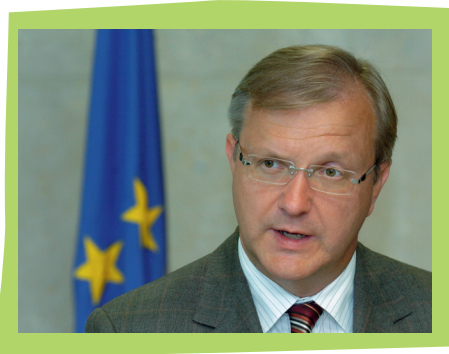
Olli Rehn Anëtar i Komisionit Evropian përgjegjës për zgjerim

G atë gjysmë shekulli, Bashkimi Evropian ka ndjekur integrimin më të thellë ndonjëherë gjatë pranimit të anëtarëve të rinj. Në të shumtën e kohës, dy proceset janë zhvilluar paralelisht. Si rrjedhojë, BE e sotshme, me 27 shtete anëtare dhe me popullatë prej afro 500 milionë banorë, është më e sigurt, më prosperuese, më e fuqishme dhe me më shumë ndikim se sa Komuniteti Ekonomik Evropian i para 50 viteve, me 6 anëtarë të tij dhe popullatë prej më pak se 200 milionë.