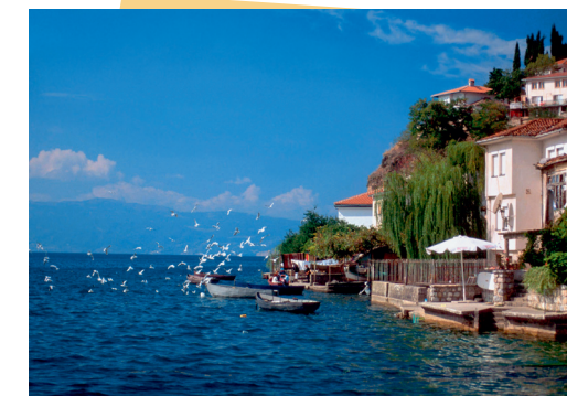
Ish-Republika Jugosllave e Maqedonisë

IPA do të ofrojë €11,468 milionë në çmimet aktuale mes 2007-2013, me alokime precize të vendosura në baza vjetore.