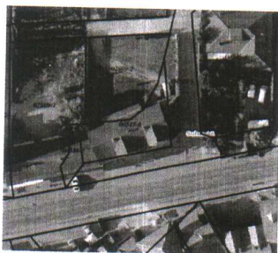
Hartë nga gjeoportali shtetëror

Drejtoria për Urbanizëm, Planifikim dhe Mjedis ka shqyrtuar kërkesën e Drejtorisë për Shërbime Pronësore – Juridike dhe Kadastër nga Suhareka, 07Nr. 350-63805 datë 14.11.2024 me të cilën ka kërkuar Përshkrim të parcelës sa i përket destinimit të saj të paraparë me Hartë Zonale të Komunës së Suharekës 2022-2030. Në bazë të materialit të ofruar përmes kërkesës, është konstatuar se parcela kadastrale nr.545-6, sipas numrit referues të certifikatës të lëshuar me datë 16.10.2024 me sipërfaqe 348m 2 gjenden në Zonën Kadastrale të Suharekës vend i quajtur Fshat, pronë e Komuna Suharekë. Është në kuadër të Hartës Zonale të Komunës së Suharekës 2022-2030 parcela është me destinim Banim me shumë njësi dhe afarizëm ZSHP-5 .