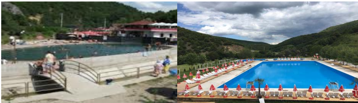
Baja e Doberqanit dhe e Uglaritë