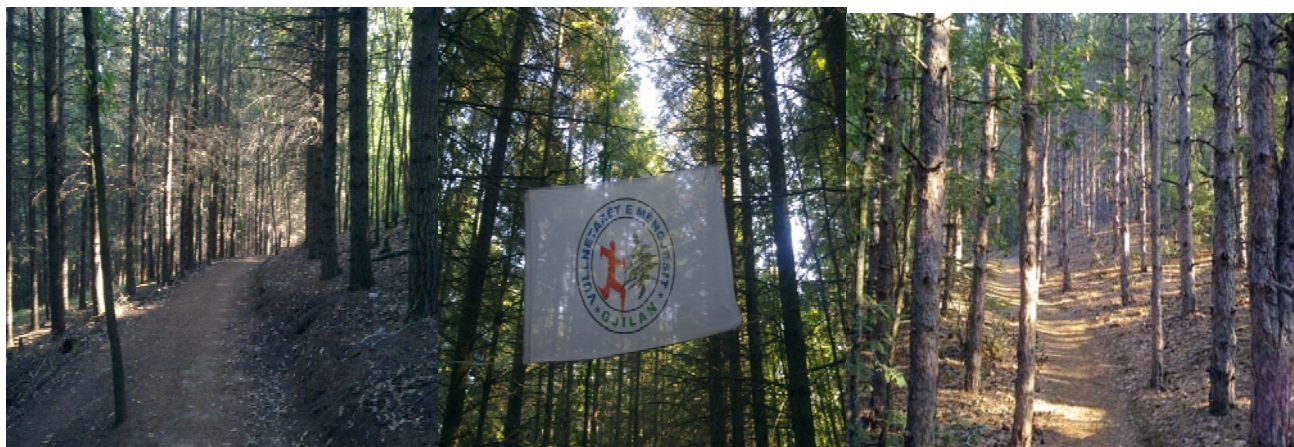
Foto e Liqenit të Perlepticës