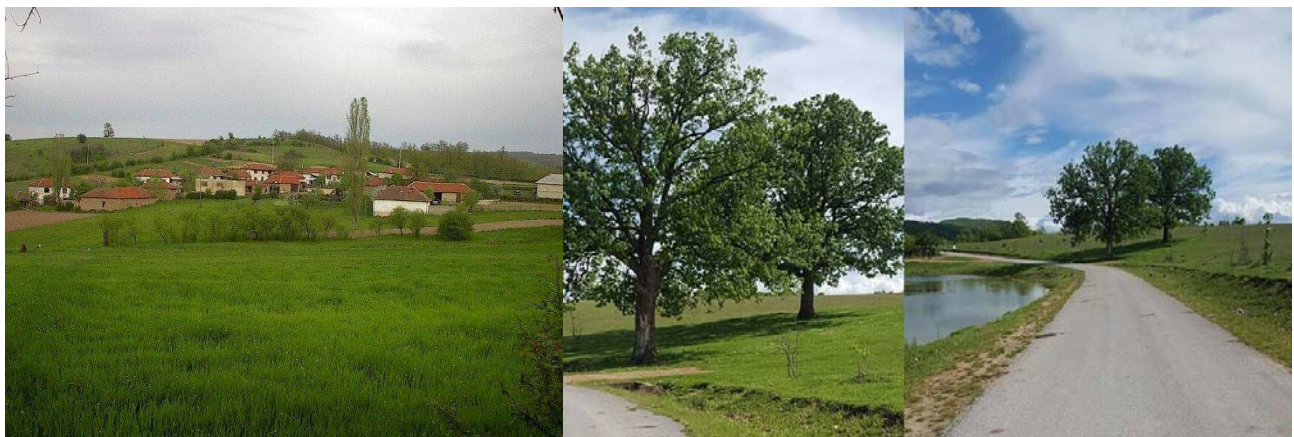
Foto e fshatit Stublinë – ku lisat gjelbërimi dhe liqeni qëndrojnë në përfaqim të njëri-tjetrit